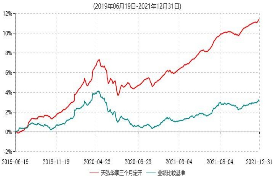
天弘华享三个月定期开放债券型发起式证券投资基金累计净值增长率与业绩比较基准收益率历史走势对比图