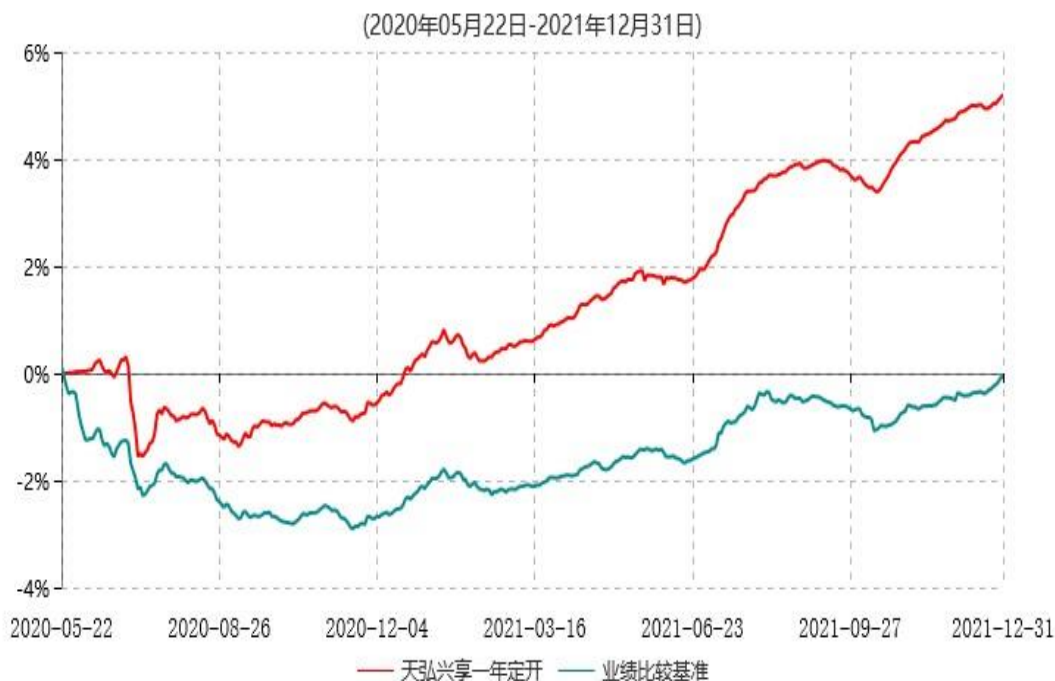
天弘兴享一年定期开放债券型发起式证券投资基金累计净值增长率与业绩比较基准收益率历史走势对比图