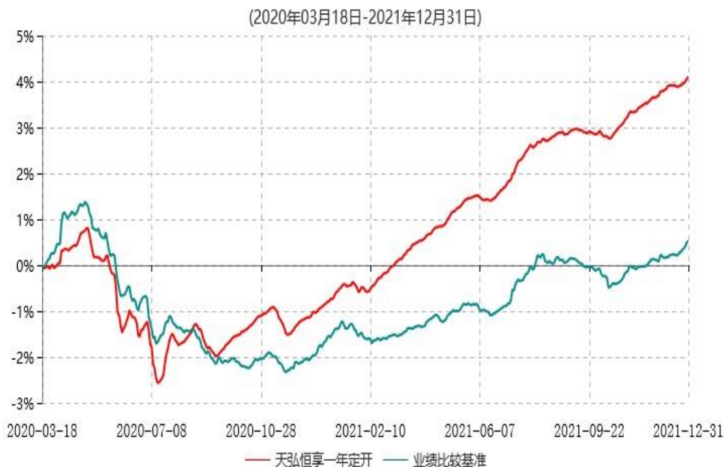
天弘恒享一年定期开放债券型发起式证券投资基金累计净值增长率与业绩比较基准收益率历史走势对比图