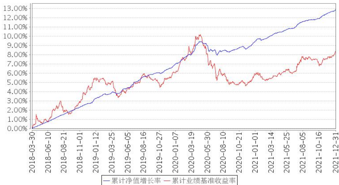
安信永盛定开债券累计净值增长率与同期业绩比较基准收益率的历史走势对比图