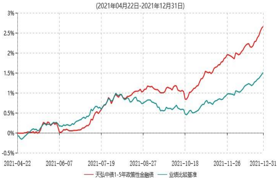
天弘中债1-5年政策性金融债指数发起式证券投资基金累计净值增长率与业绩比较基准收益率历史走势对比图

注：1、本基金合同于2021年04月22日生效，本基金合同生效起至披露时点不满1年。