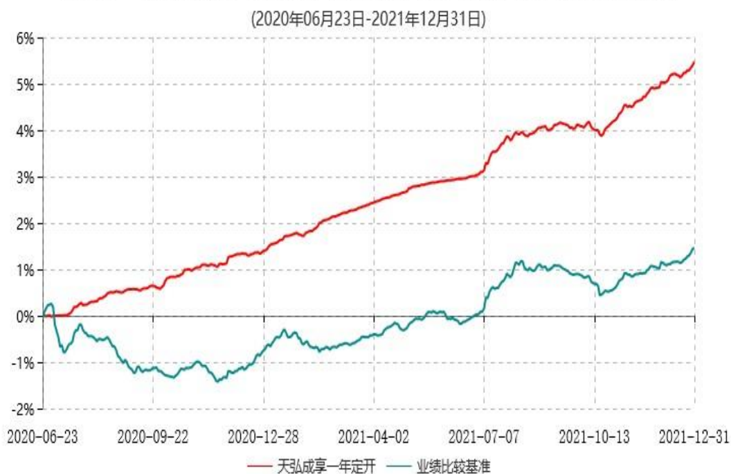
天弘成享一年定期开放债券型证券投资基金累计净值增长率与业绩比较基准收益率历史走势对比图