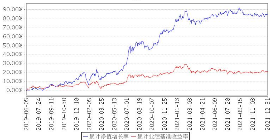
安信核心竞争力混合A累计净值增长率与同期业绩比较基准收益率的历史走势对比图