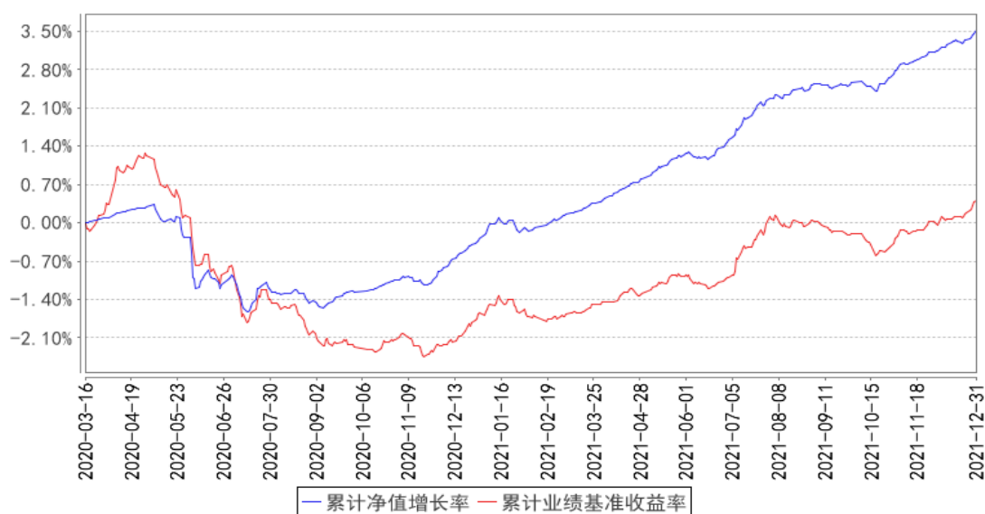
国寿安保泰吉纯债一年定开债券发起式累计净值增长率与同期业绩比较基准收益率的历史走势对比图

注：本基金基金合同生效日为 2020 年 03 月 16 日，按照本基金的基金合同规定，自基金合同生效之日起 6 个月内使基金的投资组合比例符合基金合同关于投资范围和投资限制的有关约定。本基金建仓期结束时各项资产配置比例符合基金合同约定。图示日期为 2020 年 03 月 16 日至 2021 年 12 月 31 日。