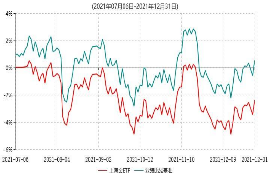
天弘上海金交易型开放式证券投资基金累计净值增长率与业绩比较基准收益率历史走势对比图

注：1、本基金合同于2021年07月06日生效，本基金合同生效起至披露时点不满1年。