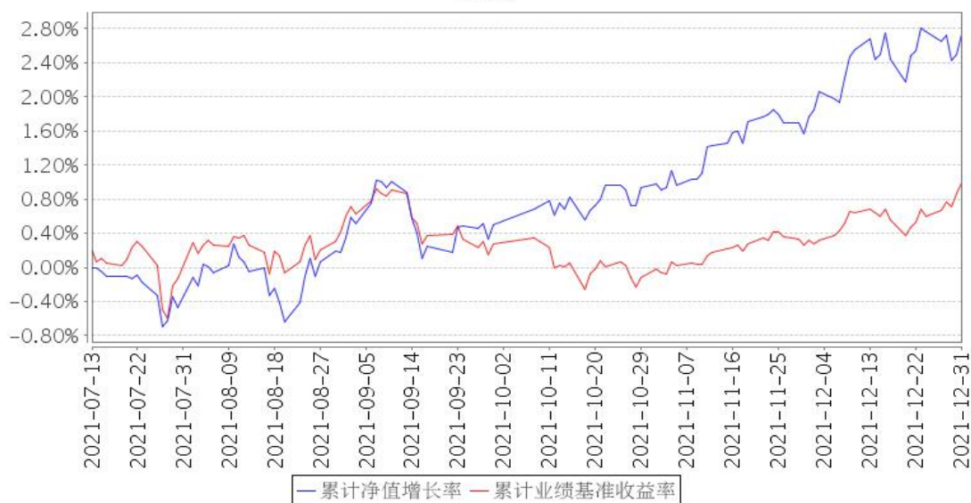
安信宏盈18个月持有混合累计净值增长率与同期业绩比较基准收益率的历史走势对比图

注：1、本基金合同生效日为 2021 年 7 月 13 日，截止至报告期末本基金合同生效未满一年。