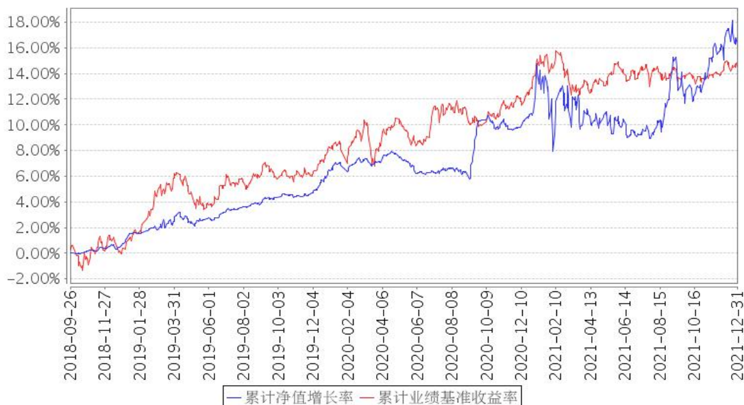
安信恒利增强债券A累计净值增长率与同期业绩比较基准收益率的历史走势对比图