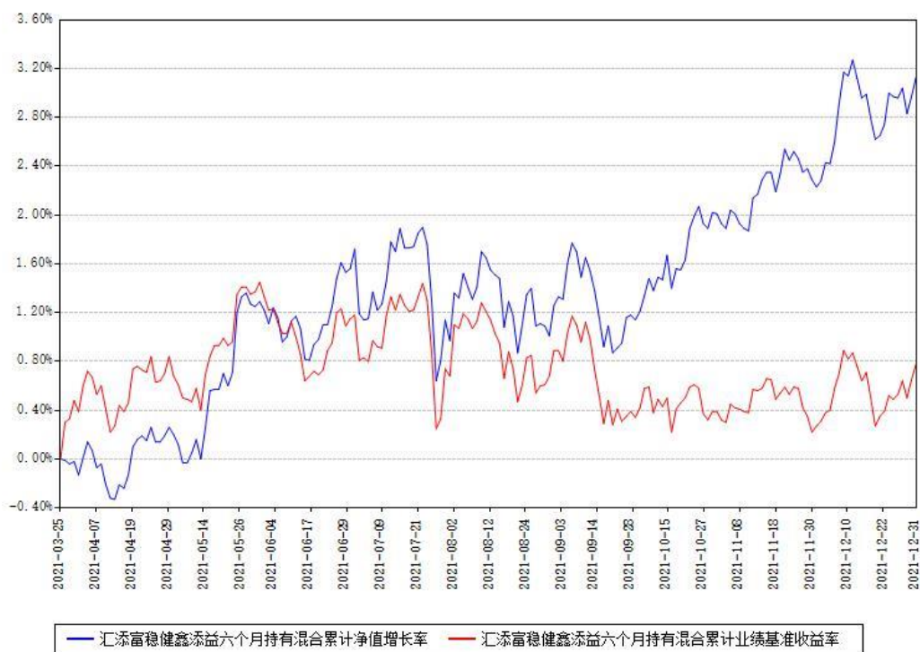
汇添富稳健鑫添益六个月持有混合累计净值增长率与同期业绩基准收益率对比图

注：1、本《基金合同》生效之日为 2021 年 03 月 25 日，截至本报告期末，基金成立未满一年。