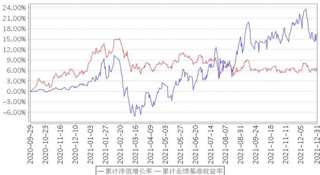
安信成长精选混合A累计净值增长率与同期业绩比较基准收益率的历史走势对比图