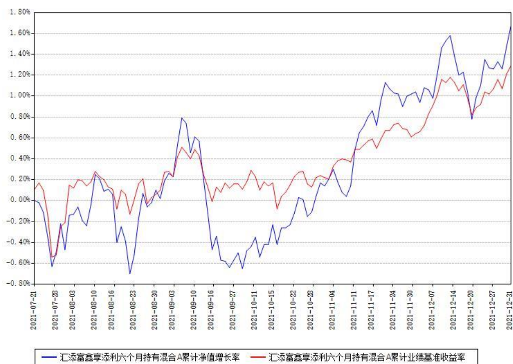
汇添富鑫享添利六个月持有混合A累计净值增长率与同期业绩比较基准收益率对比图