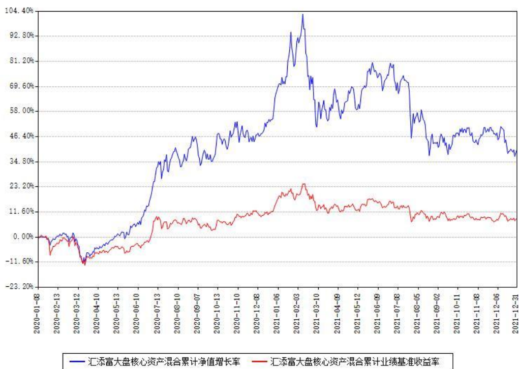
汇添富大盘核心资产混合累计净值增长率与同期业绩基准收益率对比图

注：本基金建仓期为本《基金合同》生效之日（2020年01月08日）起6个月，建仓期结束时各项资产配置比例符合合同约定。