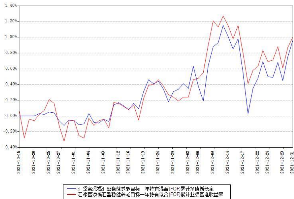
汇添富添福汇盈稳健养老目标一年持有混合(FOF) 累计净值增长率与同期业绩基准收益率对比图

注：1、本《基金合同》生效之日为 2021 年 10 月 15 日，截至本报告期末，基金成立未满一年。