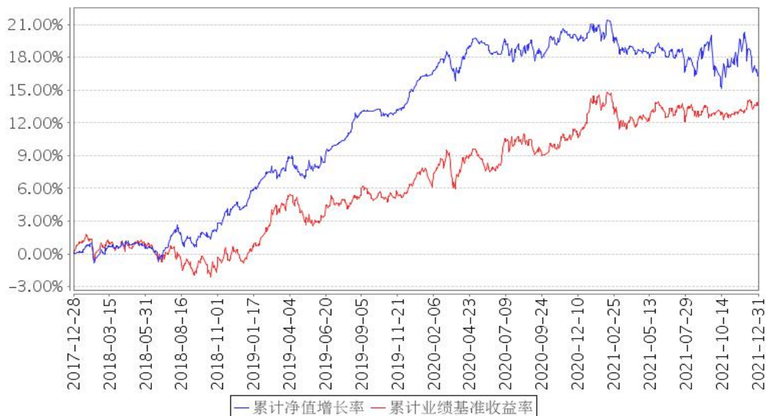
安信永泰定开债券累计净值增长率与同期业绩比较基准收益率的历史走势对比图