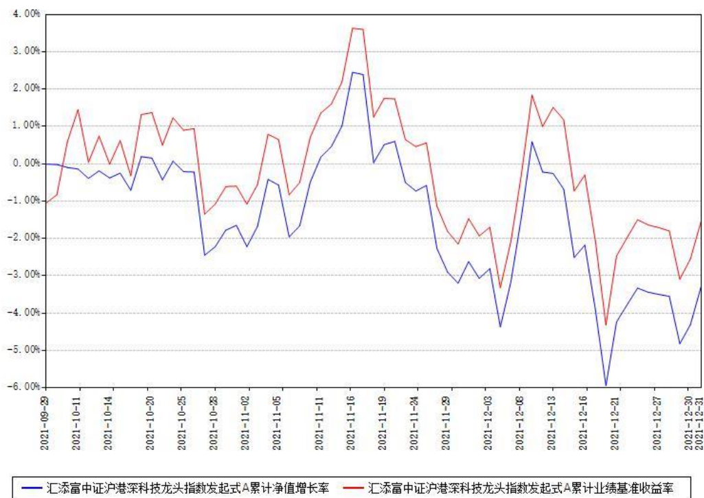
汇添富中证沪港深科技龙头指数发起式A累计净值增长率与同期业绩基准收益率对比图