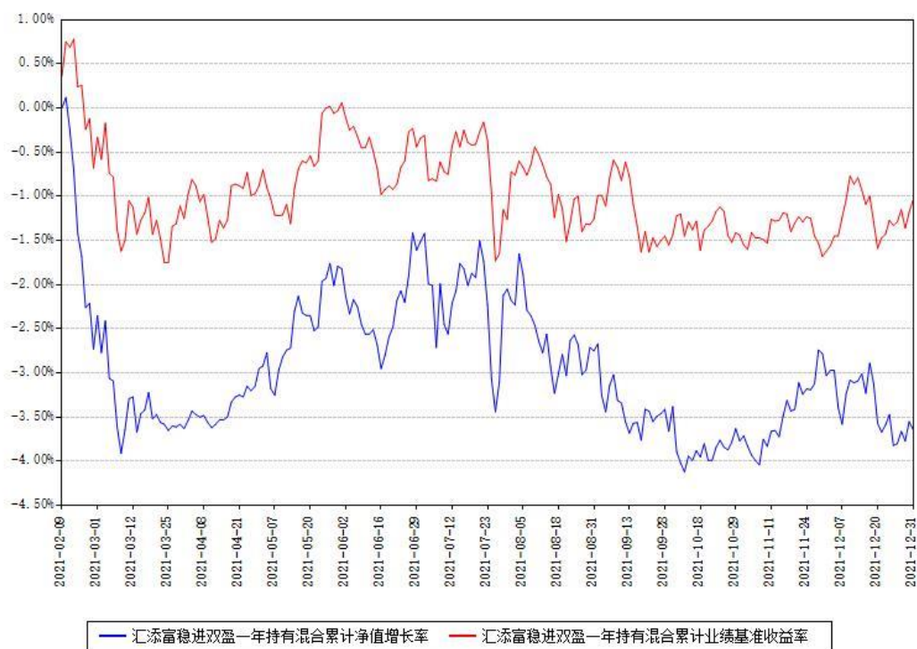
汇添富稳进双盈一年持有混合累计净值增长率与同期业绩基准收益率对比图

注：1、本《基金合同》生效之日为 2021 年 02 月 09 日，截至本报告期末，基金成立未满一年。