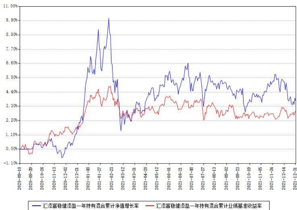
汇添富稳健添盈一年持有混合累计净值增长率与同期业绩基准收益率对比图

注：本基金建仓期为本《基金合同》生效之日（2020年09月10日）起6个月，建仓期结束时各项资产配置比例符合合同约定。