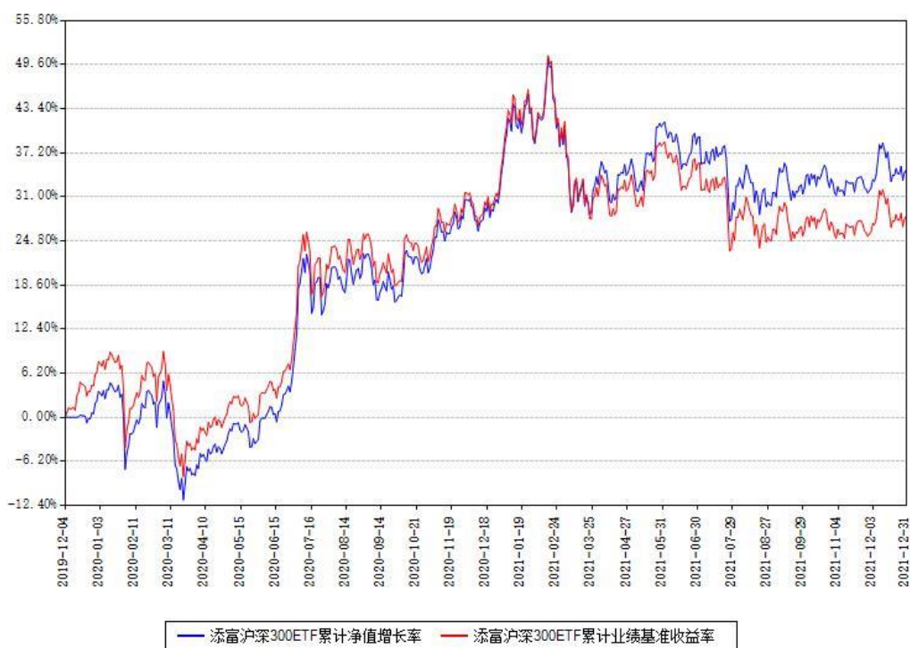
添富沪深300ETF累计净值增长率与同期业绩比较基准收益率对比图

注：本基金建仓期为本《基金合同》生效之日（2019年12月04日）起6个月，建仓期结束时各项资产配置比例符合合同约定。