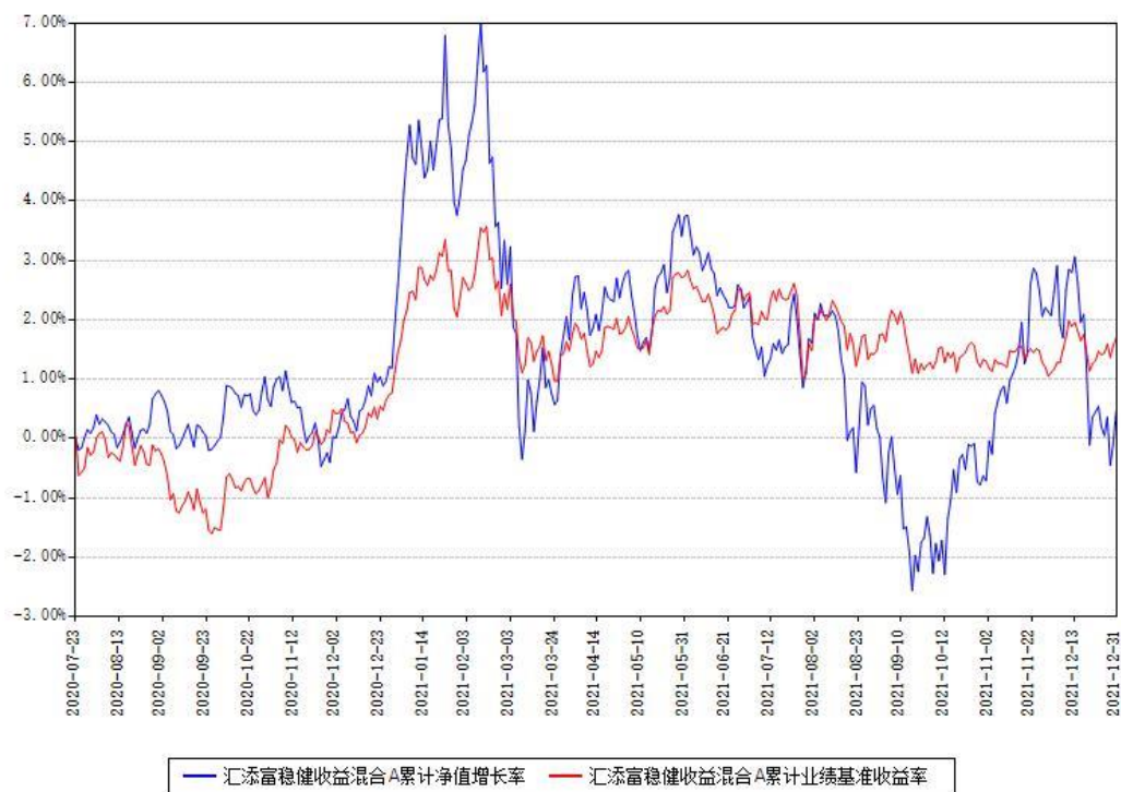
汇添富稳健收益混合A累计净值增长率与同期业绩基准收益率对比图