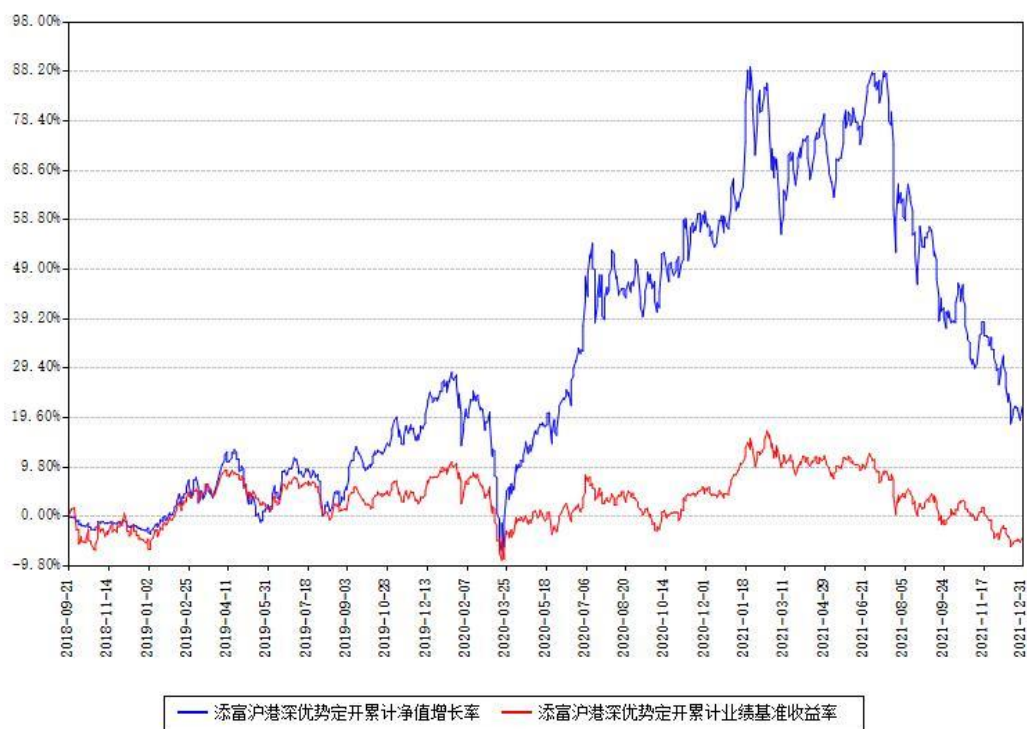
添富沪港深优势定开累计净值增长率与同期业绩基准收益率对比图

注：本基金建仓期为本《基金合同》生效之日（2018年09月21日）起6个月，建仓期结束时各项资产配置比例符合合同约定。