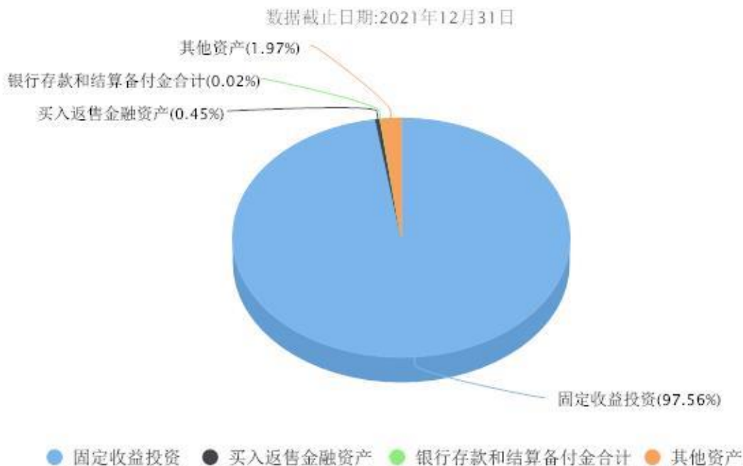
汇添富中债1-3年农发债C投资组合资产配置图表