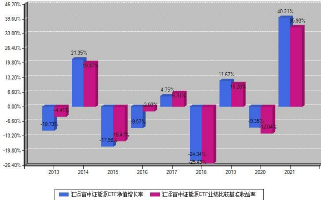
汇添富中证能源ETF每年净值增长率与同期业绩基准收益率对比图

注：基金的过往业绩不代表未来表现。本《基金合同》生效之日为2013年08月23日，合同生效当年按实际存续期计算，不按整个自然年度进行折算。