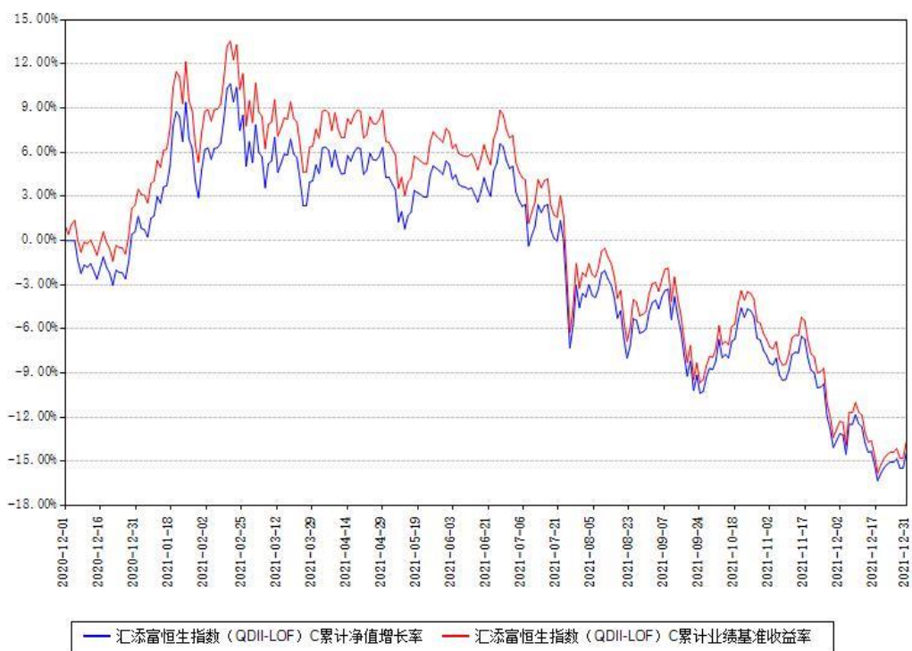
汇添富恒生指数 (QDII-LOF) C 累计净值增长率与同期业绩基准收益率对比图