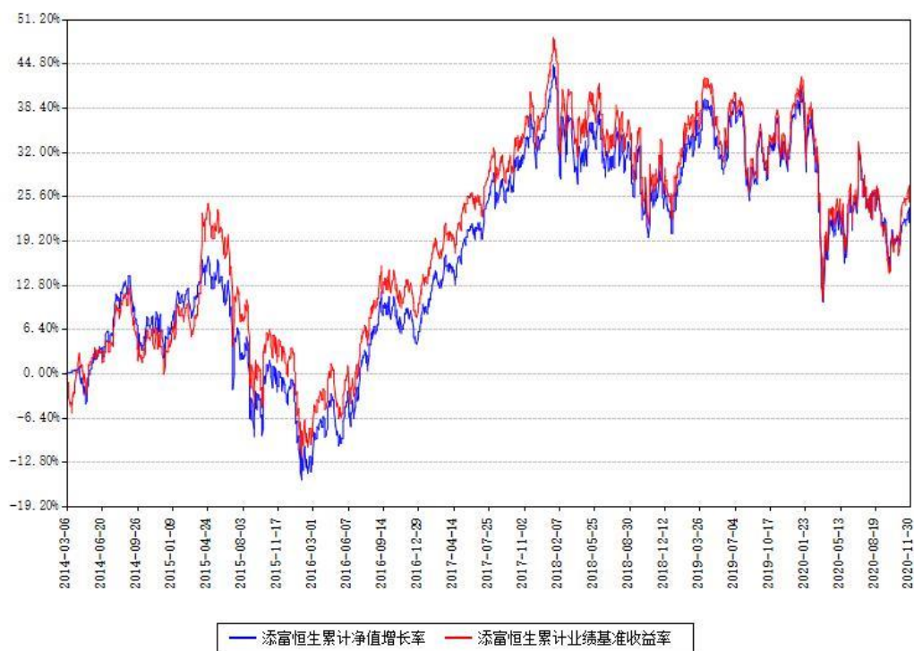
添富恒生累计净值增长率与同期业绩基准收益率对比图