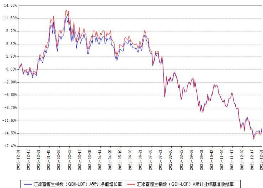
汇添富恒生指数 (QDII-LOF) A 累计净值增长率与同期业绩基准收益率对比图