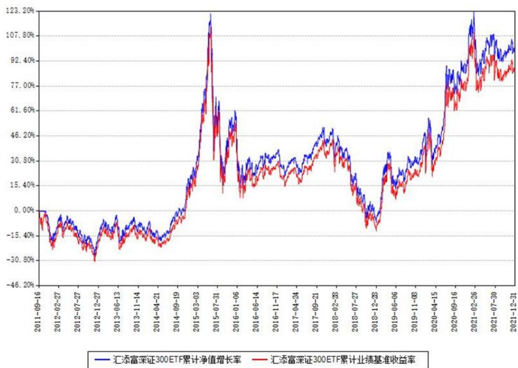
汇添富深证300ETF累计净值增长率与同期业绩基准收益率对比图