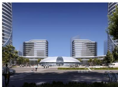
国家超算中心建筑效果图