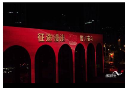
天津意风区光影秀