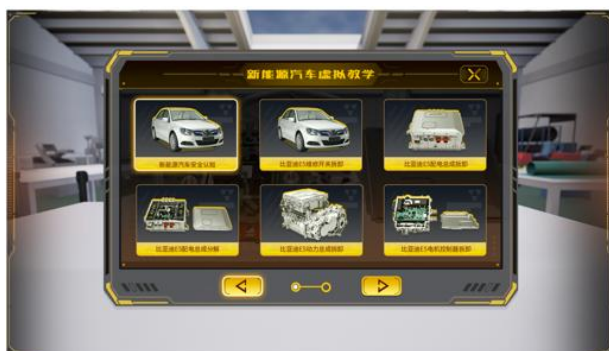
新能源汽车虚拟教学