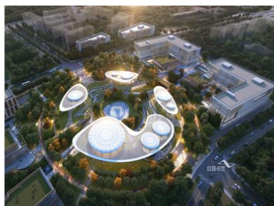
北京怀柔科学城城市客厅效果图