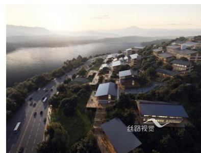
长江干部学院效果图