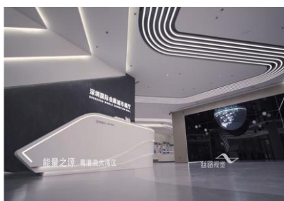
深圳国际会展中心城市展厅