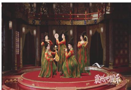
震撼吧国乐先导片