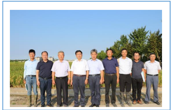
万建民院士及团队到华丰育种 基地考察