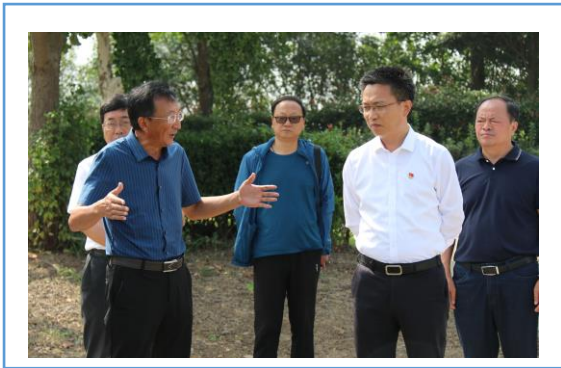
盐城市大丰区委书记李志军到 华丰育种基地调研