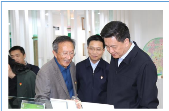
江苏省粮食督查组领导到华丰 种业调研