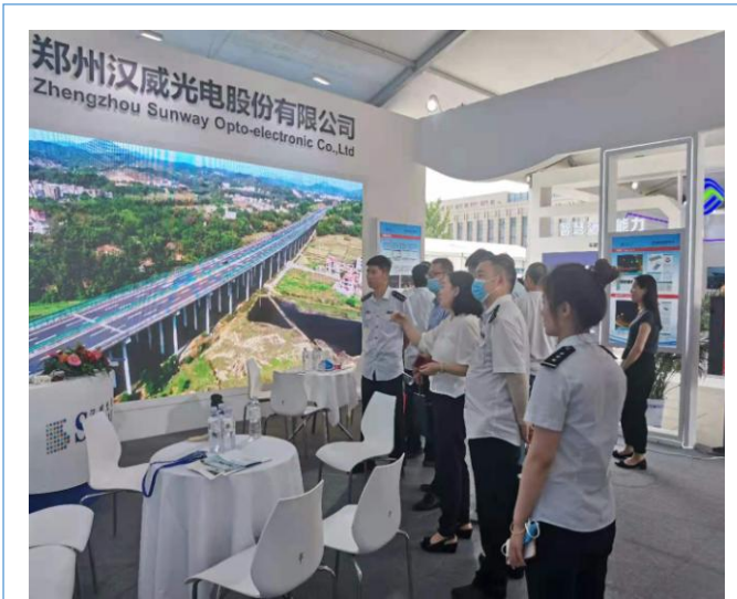
2021年6月参加河南省交通厅举办的科技创新周活动