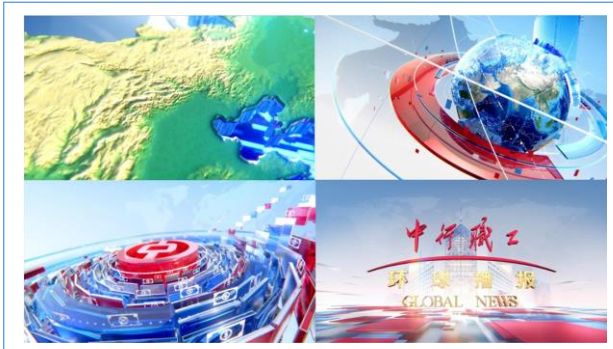
2021 中行职工环球播报