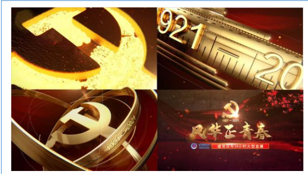
2021 CETV 风华正青春