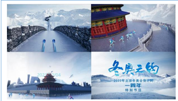
2021 北京冬奥会倒计时1周年