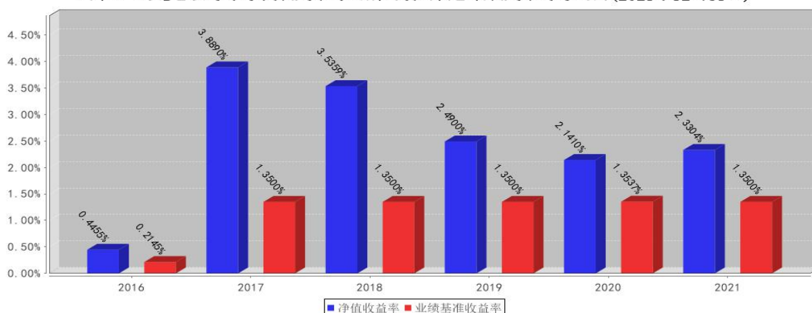
太平日日金B基金每年净值收益率与同期业绩比较基准收益率的对比图(2021年12月31日)

注：业绩表现截止日期2019年12月31日。合同生效当年按实际存续期计算，不按整个自然年度进行折算。基金过往业绩不代表未来表现。