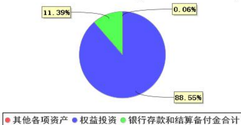
投资组合资产配置图表(2021年12月31日)