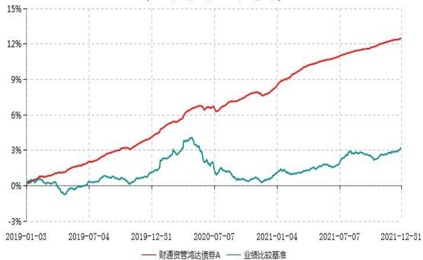
财通资管鸿达债券A累计净值增长率与业绩比较基准收益率历史走势对比图 (2019年01月03日-2021年12月31日)