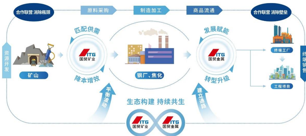
厦门国贸“铁矿-钢铁”业务模式示意图

公司从全产业链运营的视角提供定制化、一体化供应链服务方案。在原料端，公司整合境内外物资采购需求，为下游锁定原料采购成本、确保货物稳定供给；在生产端，公司提供多式联运综合物流服务，通过期货等金融工具，定制化、差异化地解决工厂的原料配比需求；在销售端，公司以全球营销网络为支点，实现产品与渠道的有效对接，赋能全产业链提质增效。公司通过供应链一体化综合服务，为生产制造企业降低成本、提高效率、优化服务，与产业链上下游 8 万余家合作伙伴共同分享价值增长收益，打造“跨界融合、平台共享的供应链商业生态圈”。