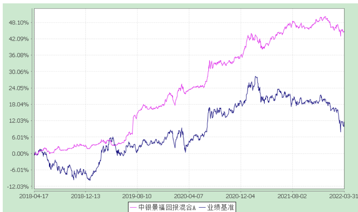
2. 中银景福回报混合 C: