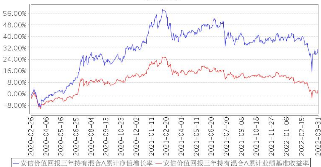
安信价值回报三年持有混合A累计净值增长率与同期业绩比较基准收益率的历史走势对比图