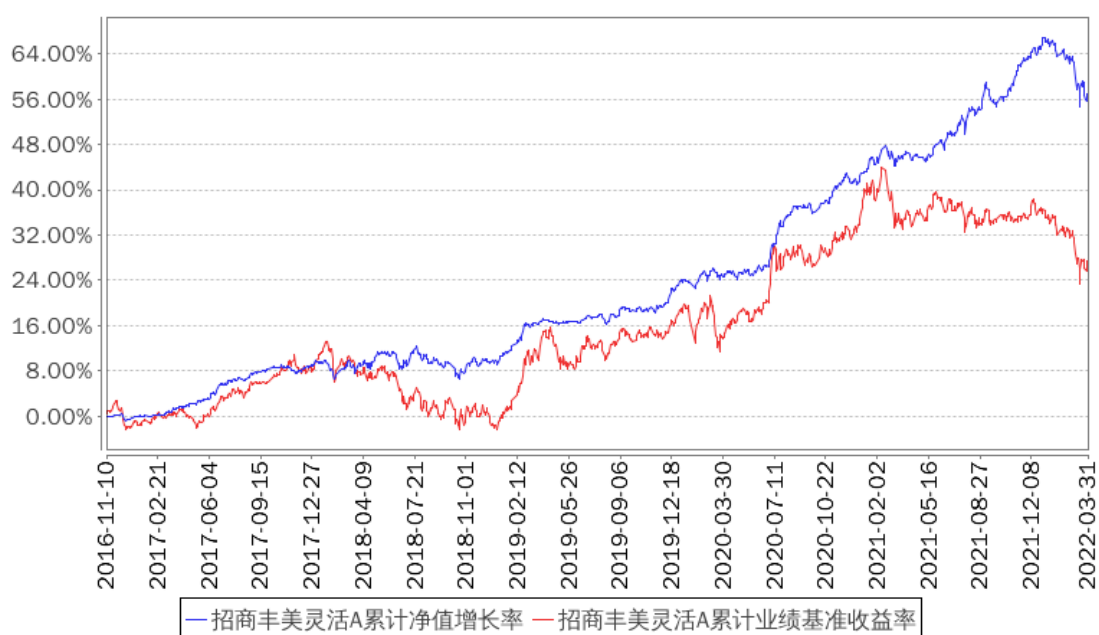
招商丰美灵活A累计净值增长率与同期业绩比较基准收益率的历史走势对比图