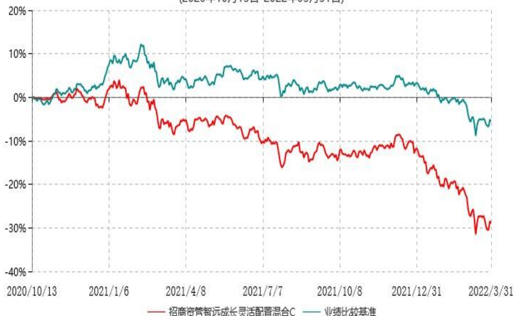
招商资管智远成长灵活配置混合C累计净值增长率与业绩比较基准收益率历史走势对比图 (2020年10月13日-2022年03月31日)

注：按集合计划合同和招募说明书的约定，本集合计划建仓期为合同生效后6个月，建仓期结束时各项资产配置比例符合合同有关规定。