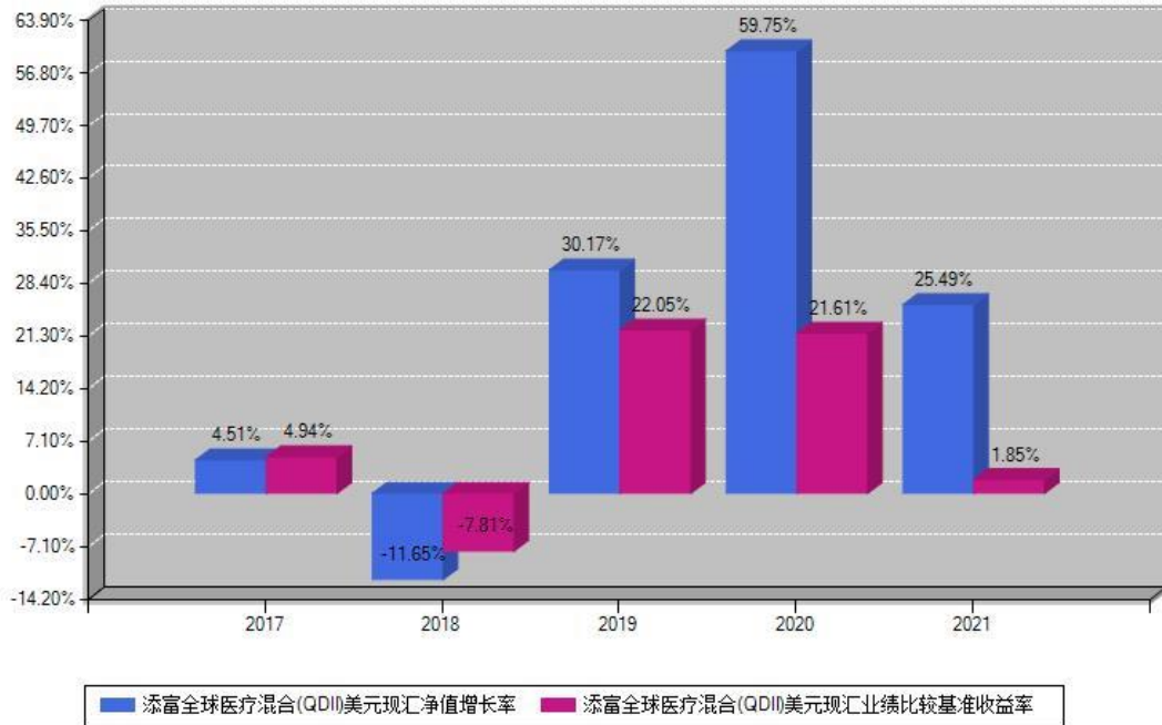
添富全球医疗混合(QDII)美元现汇每年净值增长率与同期业绩基准收益率对比图

注：基金的过往业绩不代表未来表现。本《基金合同》生效之日为2017年08月16日，合同生效当年按实际存续期计算，不按整个自然年度进行折算。