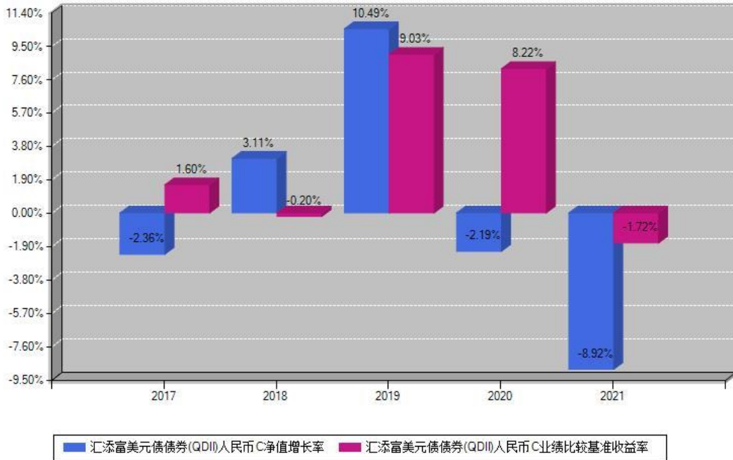
汇添富美元债债券(QDII)人民币C每年净值增长率与同期业绩基准收益率对比图

注：基金的过往业绩不代表未来表现。本《基金合同》生效之日为2017年04月20日，合同生效当年按实际存续期计算，不按整个自然年度进行折算。