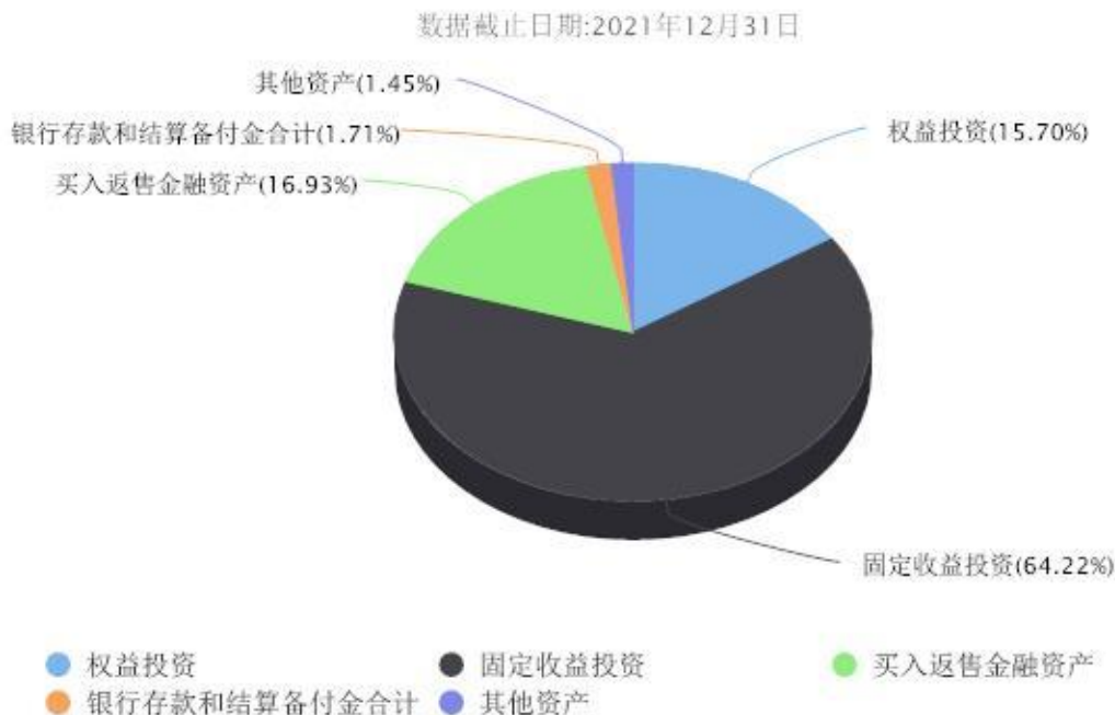
汇添富稳健增益一年持有混合A投资组合资产配置图表