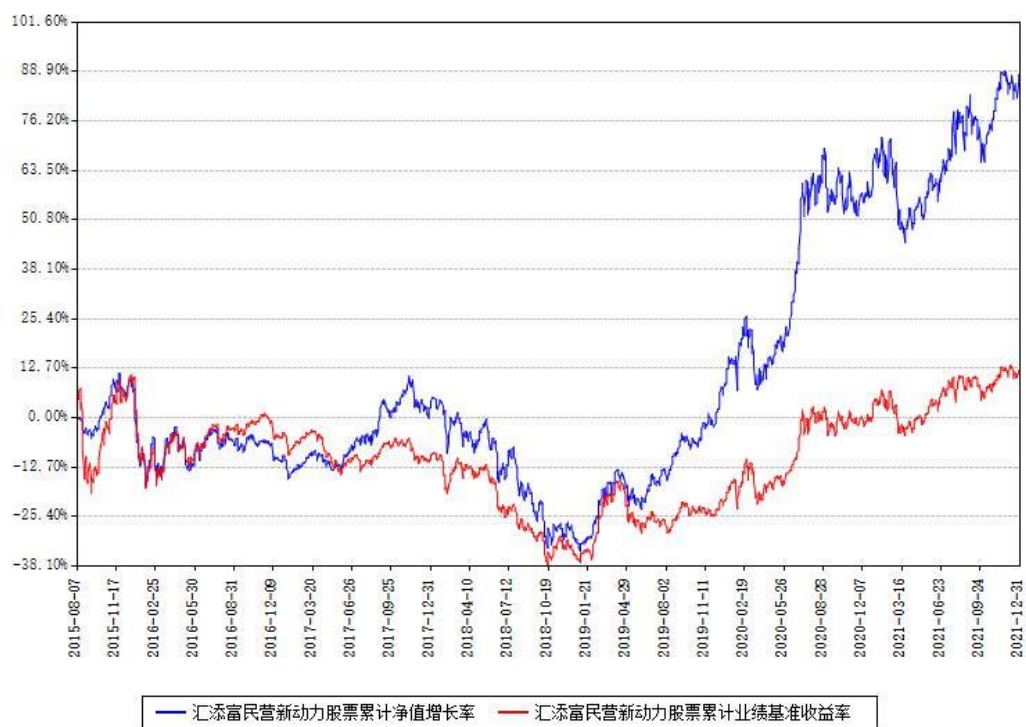
汇添富民营新动力股票累计净值增长率与同期业绩基准收益率对比图