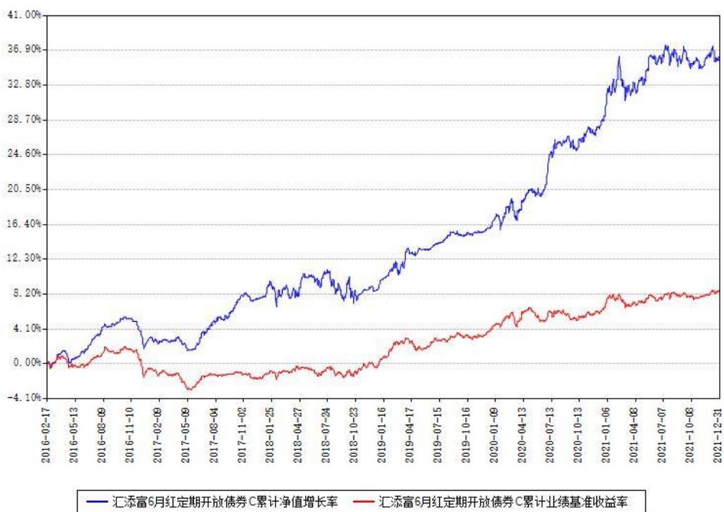
汇添富6月红定期开放债券C累计净值增长率与同期业绩基准收益率对比图