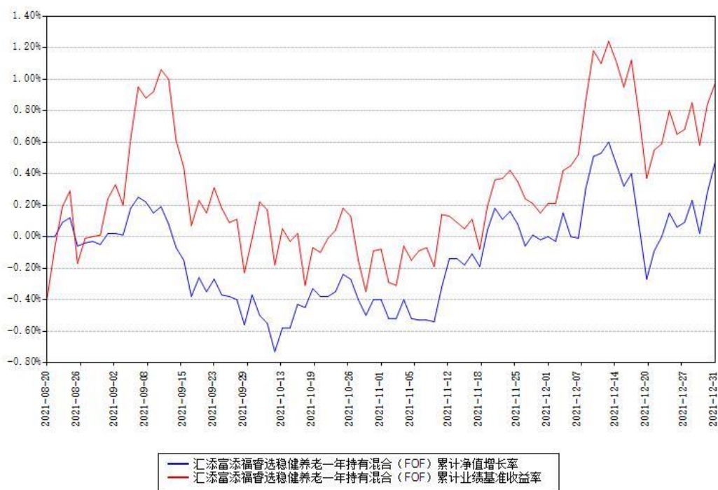
汇添富添福睿选稳健养老一年持有混合 (FOF) 累计净值增长率与同期业绩基准收益率对比图

(二) 自基金合同生效以来基金累计净值增长率变动及其与同期业绩比较基准收益率变动的比较图