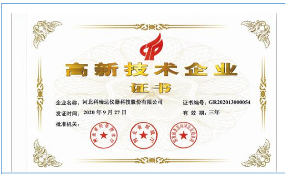
2021 年 4 月取得高新技术企业证书