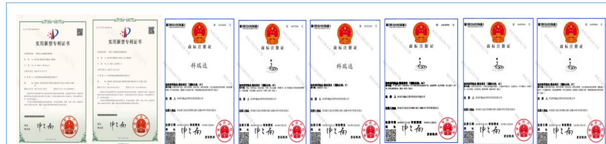
2021 年取得两项实用新型专利证书与六项商标注册证书