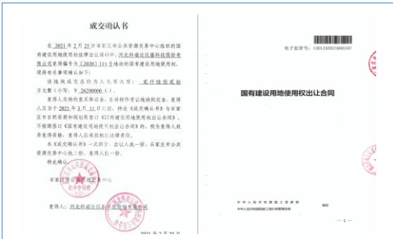
2021 年 2 月成功竞得国有建设用地使用权并签订合同