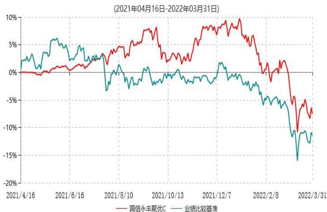
圆信永丰聚优C累计净值增长率与业绩比较基准收益率历史走势对比图

注：自基金合同生效后，截止报告期末，本基金成立不满一年；本基金已完成建仓但报告期末距建仓结束不满一年，建仓结束时各项资产配置比例符合合同约定。