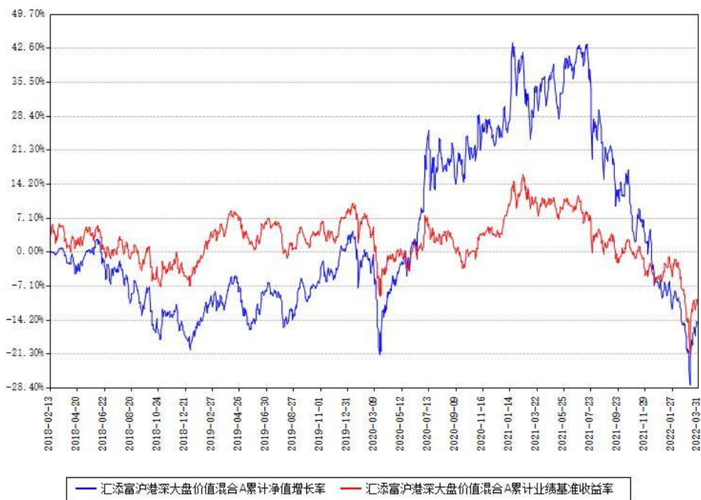
汇添富沪港深大盘价值混合A累计净值增长率与同期业绩基准收益率对比图