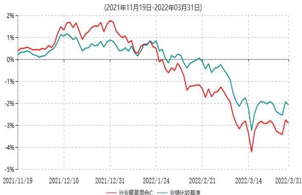
兴业聚盈混合C累计净值增长率与业绩比较基准收益率历史走势对比图