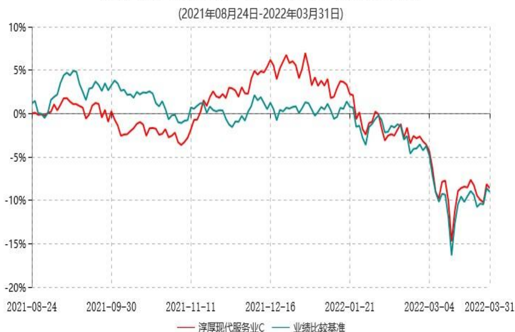
淳厚现代服务业C累计净值增长率与业绩比较基准收益率历史走势对比图

注：本基金基金合同生效日为 2021 年 08 月 24 日，至报告期末未满 1 年。按基金合同规定，本基金自基金合同生效起 6 个月内为建仓期。建仓期结束时本基金的各项投资比例均符合基金合同约定。